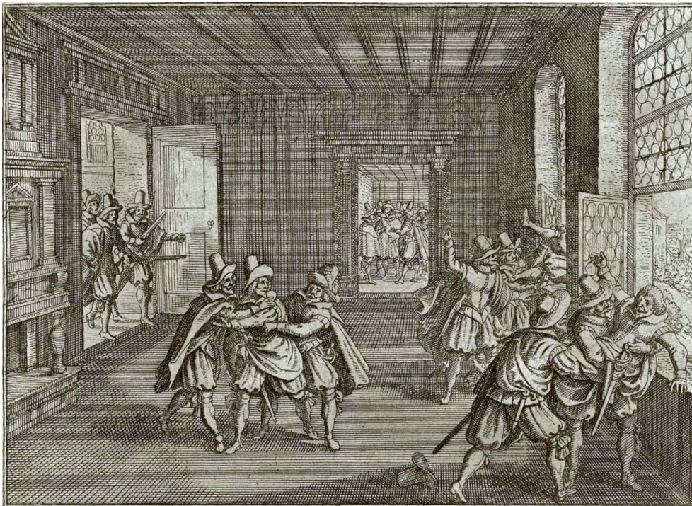
Johann Philipp ABELINUS, Theatrum Europaeum 1, s. 16.

Učitel může navázat na předchozí látku otázkami, jaká událost je zachycena na rytině, jak událost souvisí s tématem změny společnosti apod.