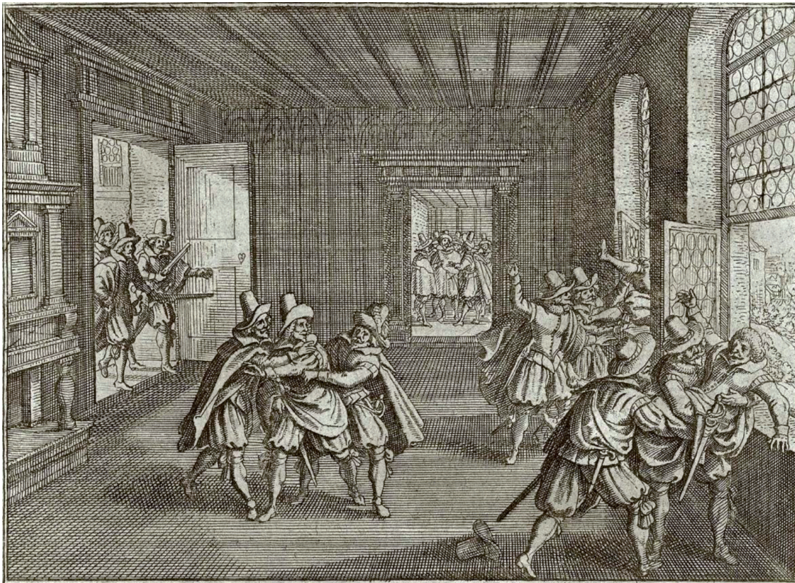
Johann Philipp ABELINUS, Theatrum Europaeum 1, s. 16.

Jak se po Bílé hoře změnil způsob vlády?