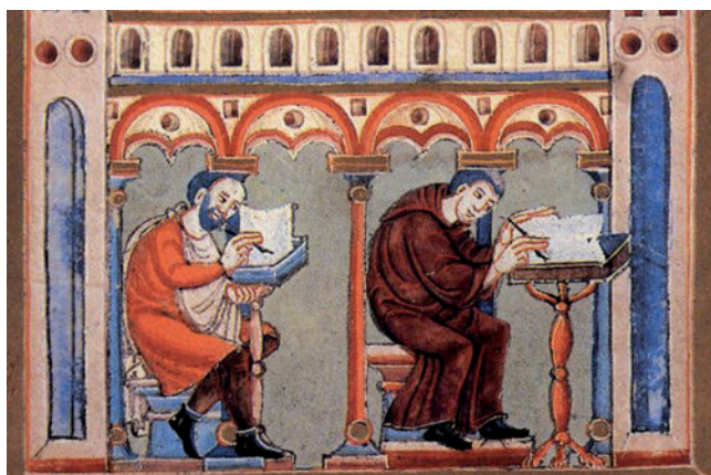
Skriptorium v Eternachu, Book of Pericopes of Henry II , 11. století (Wikimedia Commons).

1. Porovnejte obrázky, které dokumentují výrobu knihy před vynálezem knihtisku a po něm. Přiřadte správné pojmy (čísla) k prvnímu či druhému obrázku: (1) pomalé, (2) rychlé, (3) jeden člověk, (4) skupina lidí, (5) klášter, (6) dílna