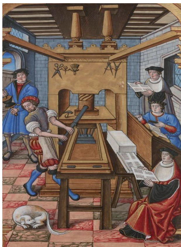
Francouzská tiskárna kolem roku 1500.